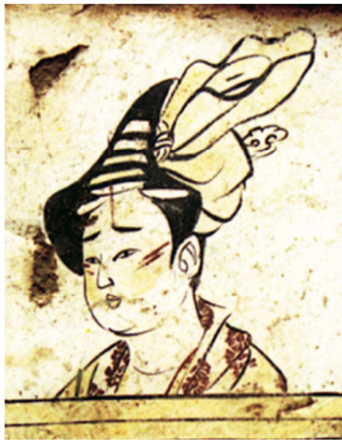
图1 墓室西北角壁画局部（赵逸公墓出土）。

步吸收了胡人妆容的特色。虽然继承了传统的妆造步骤，但同时，也结合胡风进行了融合。