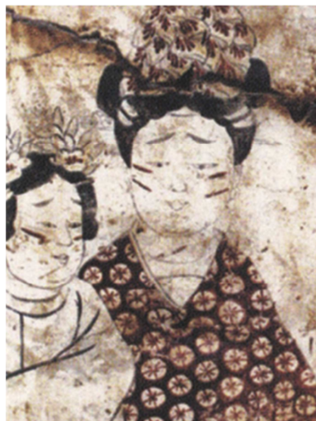
图9 墓室壁画局部（赵逸公墓出土）。