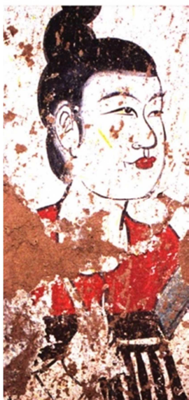
图5 《拈柳枝女侍图》局部（燕妃墓出土）。