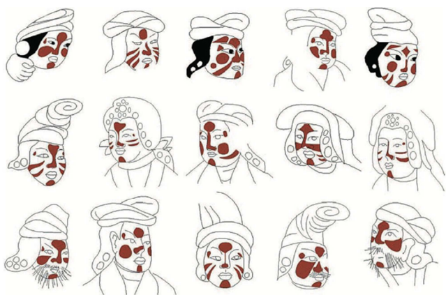
图8 郭里木吐蕃墓葬棺板画中的妆容（来自刘波《椎髻赭面——从安阳唐墓看中晚唐时期女子服饰中的胡风》）。

再回到上文所提到的唐朝的时世妆，这种看似古怪的妆容与当时吐蕃民族的妆容造型有所相通，现继续追溯源流。首先来看同时期吐蕃女性的妆容，从郭里木吐蕃墓葬棺板画中可以提取到的妆容有：