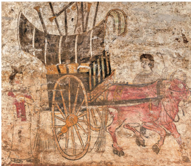
图2 《牛车备行图》局部（郭行墓出土）。