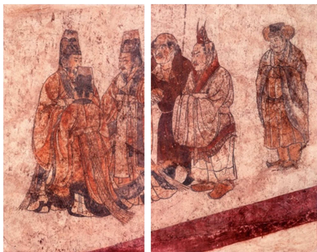
图3 《客使图》局部（章怀太子墓出土）。